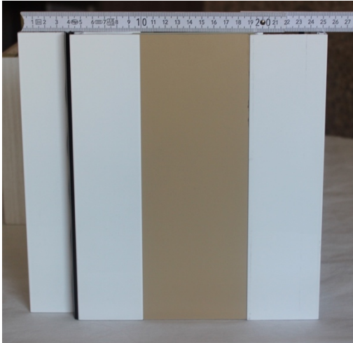
Expandible 26 cm de espesor de muro