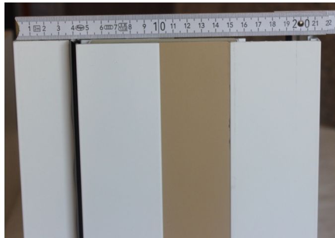
Expandible 21 cm de espesor de muro