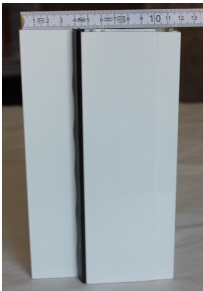
Expandible 12 cm de espesor de muro