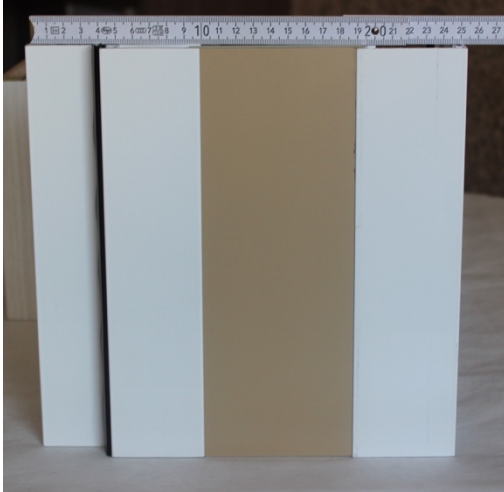
Expandible 26 cm de espesor de muro